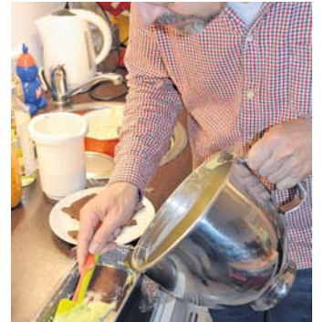
Schicht um Schicht füllt sich die Kastenform mit dem Naschwerk.