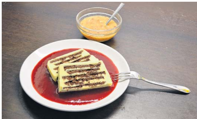
Wie lecker ist das denn: Kalter Hund aus weißer Schokolade, selbstgebackenen dunklen Keksen mit Pfirsichen und Himbeeren.

Mit wenigen Gerichten lassen sich so viele schöne Kindheitserinnerungen wiederbeleben. Hmm, lecker: