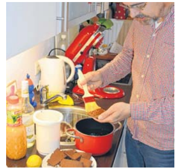
Streichen Sie die Kekse mit Aprikosenkonfitüre ein.