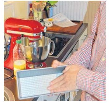
Ölen Sie die Backform ein, dann mit Klarsichtfolie auslegen.

3. Aprikosenkonfitüre leicht erwärmen und die Kekse auf jeweils einer Seite damit bestreichen. Eine Kastenform leicht einölen und mit Klarsichtfolie auslegen. 3-4 El der Schokoladencreme in der Form verteilen und glatt streichen. Die kleinsten Kekse mit der bestrichenen Seite auf die Creme legen und andrücken. Restliche Creme und Kekse