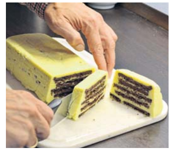
Der große Moment: Kekstorte aufschneiden - und genießen.

einschichten. Letzte Schicht sollten Kekse sein. Mit Folie verschließen und am besten über Nacht kaltstellen.